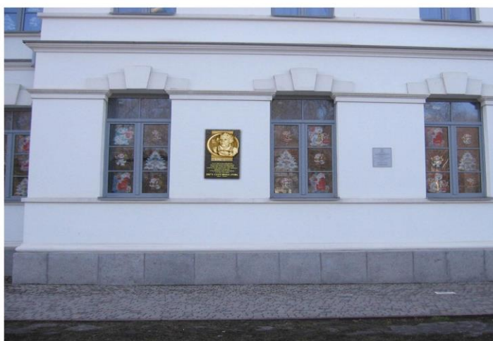
Розміщення меморіальної дошки на фасаді будинку за адресою: м. Полтава, вул. Соборності, 35.